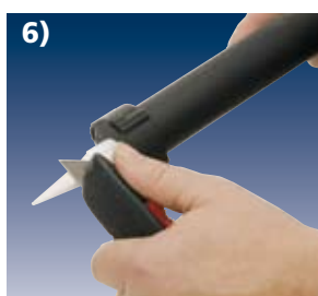
6) Düsenspitze in der gewünschten Öffnungsgröße abschneiden