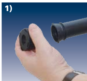
1) Bajonettverschluss abdrehen