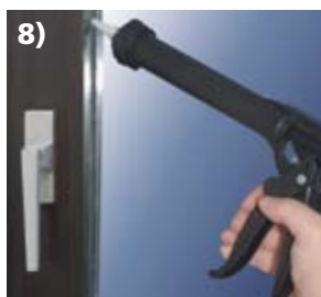
8) Und los geht's mit dem Kleben oder Abdichten!