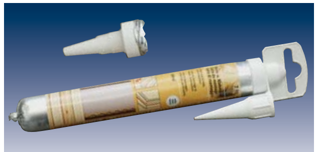
Vorher – nachher: Der Abfall hat in der Düse Platz!