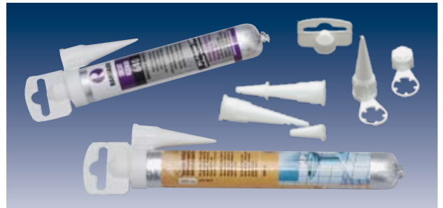
Folienbeutel + Düse/Kappe = Folientube!