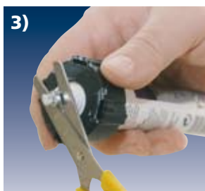
3) Beutel aufschneiden