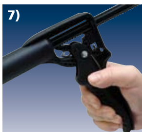
7) Zwei- bis dreimal den Griff (Abzugsbügel) betätigen, um Druck aufzubauen