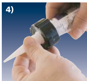
4) Düse aufs Gewinde schrauben (nach Gebrauch mit Schraubkappe fest verschließen)