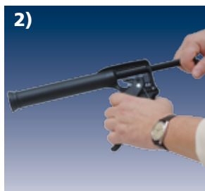
2) Schubstange entspannen (90° drehen, zurückziehen)