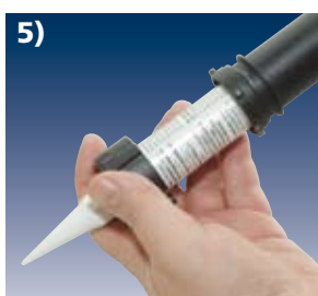
5) Folientube einlegen Bajonettverschluss aufsetzen