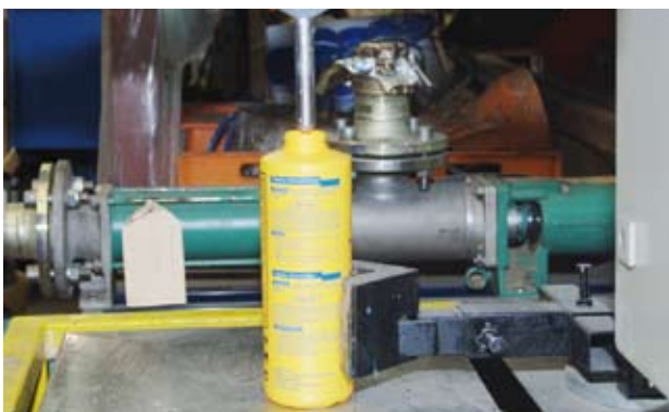
Vollautomatisch: Abfüllung in Flaschen.