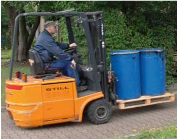
Wir bewegen Chemie.