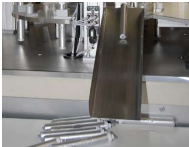
Folientuben: Exakt dosiert und fertig abgepackt.