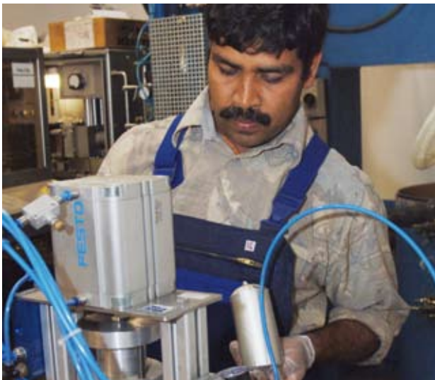
Bei uns geht nichts ungeprüft in den Markt.