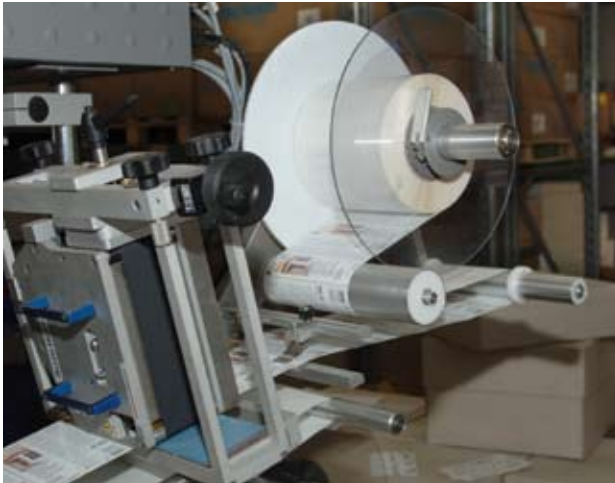
Kundenindividuell und im Kunden-CD: automatische Etikettierung.