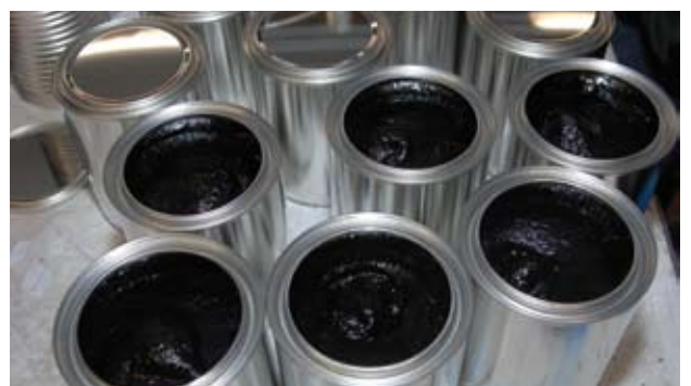
... voller Nutzen.