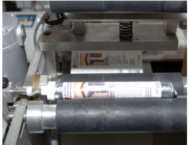
Verpackung und Ettiketerung ist unser Thema.