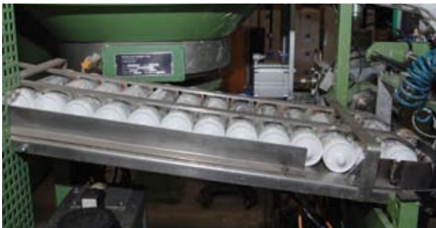
Am laufenden Band: kleine Einheiten.