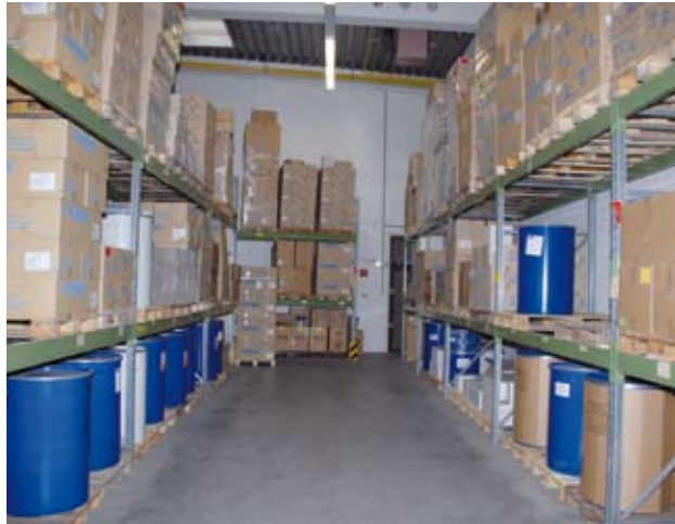
Prozessoptimiert von Anfang an: Rohstofflager mit Leergebinden und den Fässern aus der Kundenproduktion.