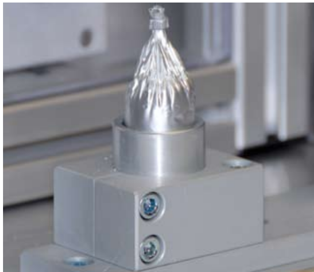
Genauigkeit im Detail ist unser Thema.