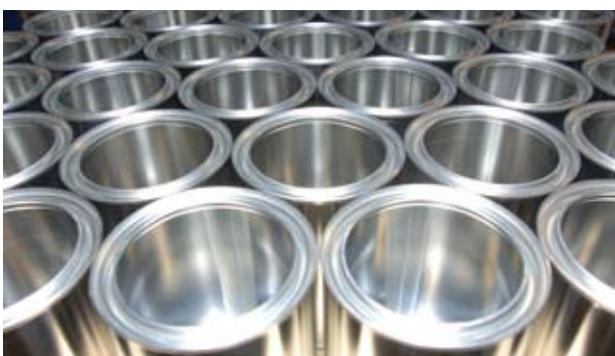
Kein leeres Versprechen ...