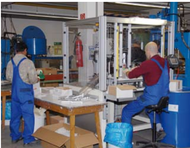
Wir verstehen was von Prozessen – und lassen die Produktionsanlagen nach unseren Vorstellungen entwickeln.