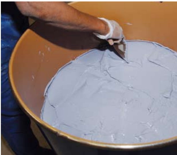
Für optimale Konsistenz: Glattnstrich der pastösen Masse im Fass.