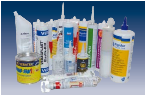
Alles fo la: unterschiedlichste Medien, Größen und Gebinde.