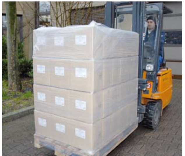
Wir sorgen dafür, dass die Ware pünktlich bei Ihnen ankommt.